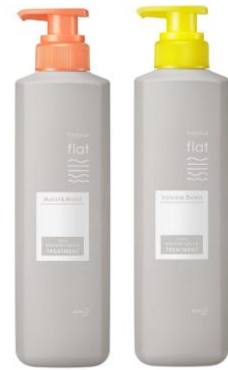
<モイスト&モイスト> <ボリュームダウン>

※ 1 熱を加えた時に髪を柔軟化し、扱いやすくする整髪成分(イソステアリルグリセリル)