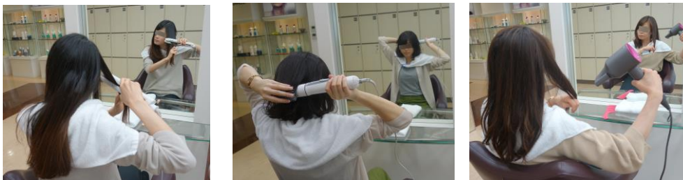
(くせ・うねり悩みをもつモニターのスタイリングの様子:花王調べ)

さらに、髪のかせ・うねり悩み実態の研究を通じて、くせの出る部位や状態は人によってさまざまであり、それに合った適切なお手入れ方法があることもわかってまいりました。また、時間と手間をかけてスタイリングしても、仕上がりは日によって異なり満足できない場合も多く、適切なお手入れができていない実態も見てきました。