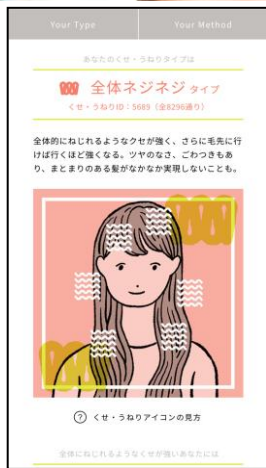
くせ髪タイプ分析結果イメージ