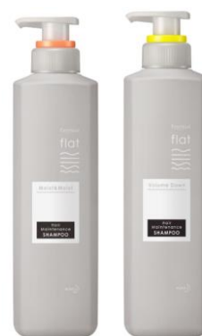
<モイスト&モイスト><ボリュームダウン>