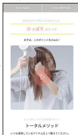
くせのタイプ別に おすすめのお手入れ方法をご紹介

・ブランドサイト: https://www.kao.co.jp/essential/flat/