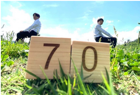
カウントダウン写真の例

また、多くの方々に市制施行70周年及び記念事業を周知するため、ポスターや横断幕等を作成しました。