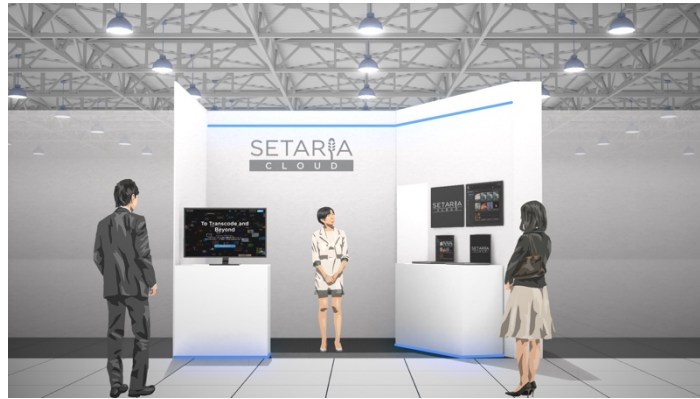
出展ブース（イメージ）