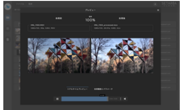
処理比較プレビュー (左：処理前／右：処理後)