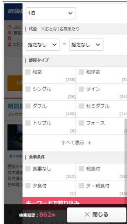
「スペック検索」スマホ画面イメージ