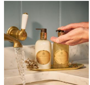
フェスティブヴィンテージ エルダーフラワー ハンドウォッシュとハンドローション イメージ

またパブリックエリアでは、シャンパンをイメージした華やかな香りのホリデイ限定フレグランス「フェスティブヴィンテージ エルダーフラワー」のハンドウォッシュとハンドローションをご利用いただけます。