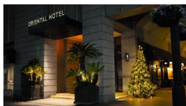
オリエンタルホテル 外観

神戸の歴史を感じる洋館建築と、美しい石造りの街並み。高級メゾンが立ち並び、開港時の面影残る旧居留地25番地は、気品に溢れた神戸を象徴する場所です。オリエンタルホテルはこの土地で、150年以上の歴史を誇ります。たくさんの人々と街に見守られ、愛されながら、戦前戦後と世界中から訪れる賓客をもてなしてきました。一世紀の時が経った今も、開業時から大切にしている一流のサービスと料理へのこだわりは、変わることなく受け継がれています。