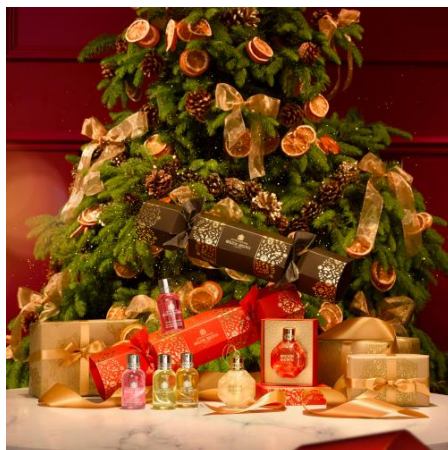
モルトンブラウン ホリデイコレクション 2023 イメージ

ホリデイコレクション2023詳細： https://www.moltonbrown.co.jp/pages/christmas