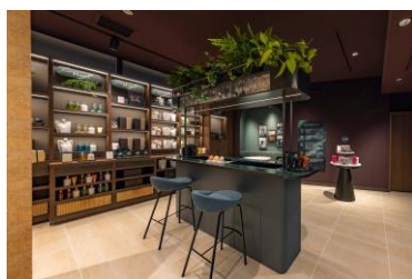
モルトンブラウン 神戸BAL店 店内

2023年7月にオープンした関西初の直営店です。オードパルファンなどのほか、水が流れるユニットシンクでハンドウォッシュなどをお試しいただけます。ぜひお立ち寄りください。