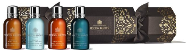
ウッディ&アロマティック クラッカー