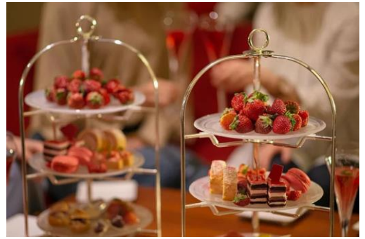
ナイトアフタヌーンティー イメージ

また、高層階ならではのシティビューで神戸の夜景を臨める「The Bar J.W.Hart」では、モルトンブラウンのホリデイコレクションをイメージした特製カクテルもご堪能いただけます。