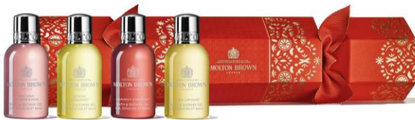
フローラル&フルーティ クラッカー

こちらのプランでご宿泊の方に、11月15日発売のホリデイコレクションから「フローラル&フルーティ クラッカー」と「ウッディ&アロマティック クラッカー」をプレゼント。それぞれ4種の香りのバス&シャワージェルがクラッカー風のパッケージに入った、遊び心いっぱいのギフトセットです。