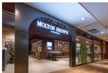
モルトンブラウン 神戸BAL店 正面