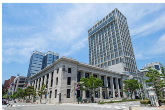
オリエンタルホテル 外観

所在地：兵庫県神戸市中央区京町25 WEB： https://www.orientalhotel.jp/