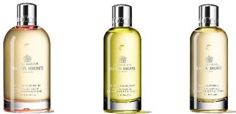
バス&ボディスPECIALケア