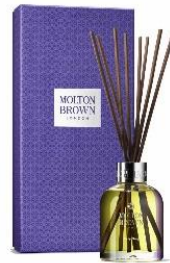
ホームフレグランス