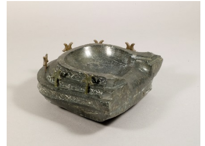
【重要文化財】石枕 [姉崎二子塚古墳出土・5世紀]