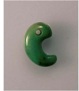
勾玉 [常陸鏡塚古墳出土・4世紀]

4世紀から9世紀にかけて、神々に祈りを捧げる祭祀が行われていた沖ノ島は、今にその姿を残して「神道」の原型を物語る例のない貴重な文化遺産。しかし、「神道」は、教祖・教義・経典をもたない宗教であり、古代における祭祀の具体像も未だ神秘のヴェールに包まれたままといえます。