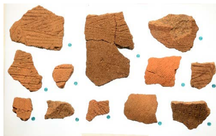
居家以岩陰遺跡から出土した土器