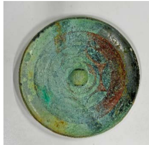
内行花文鏡 [伝沖ノ島出土・4世紀]