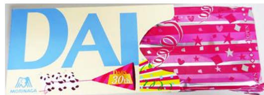
▲クラッカーから紙吹雪が飛び出しているような仕掛け 30周年限定のデザイン

さらに、ダースでおなじみの「レアパッケージ」やパッケージ側面の「PAN DARSの仕掛け」も引き続きお楽しみいただけます。