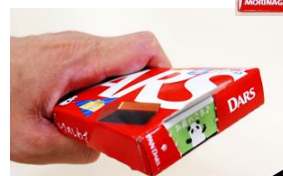
◀パッケージ側面の PAN DARS や 隠れメッセージ

■パッケージの側面にある PAN DARS の切り取り線部分を開けると、PAN DARS の可愛いデザインや「お疲れさま」「ありがとう」など、癒される隠れメッセージが！