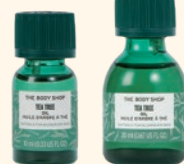
TT オイル 美容オイル 10mL 2,200円 20mL 3,190円

オイルなのにさらっとしたテクスチャーで、皮脂など気になる部分のスポットケアにおすすめの美容液です。ティーツリーオイル ※1 を直接肌に使えるように希釈してあります。敏感肌の方にもおすすめです。