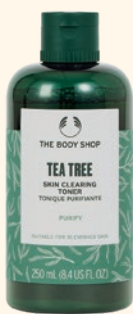
TT スキンクリアリング トナー 化粧水 250mL 2,750円

1つで洗顔、スクラブ、マスクができる、皮脂が気になる肌におすすめのスクラブ洗顔料です。カオリンクレイ ※4 をベースに、パーライト ※5 などのスクラブ成分配合で、余分な皮脂や古い角質、毛穴の汚れをすっきりとクリアに導きます。95%自然由来成分配合。敏感肌の方にもおすすめです。