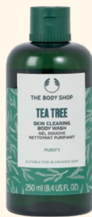
TT スキンクリアリング ボディ ウォッシュ ボディシャンプー 250mL 2,420円

爽やかに香りながら、豊かな泡立ちでさっぱりと洗いあげらなめらかなジェルテクスチャーのボディシャンプーです。93%自然由来成分配合。背中ニキビなどが気になる方にもおすすめです。