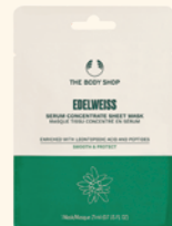
EDW セラムシートマスク シート状マスク 21mL 990円

パワフルな2種のエーデルワイスエキス ※1 に加え、ブッドレアエキス ※7 や肌にうるおいを与えるモリンガシードオイル ※2 などを配合した自然由来成分96%の美容液ミスト。ジェル状からミストへ変化するユニークなテクスチャーがピタッと肌に密着し、ふっくらしなやかな肌へ導きます。