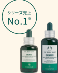
EDW コンセントレート セラム 美容液 30mL 6,270円 50mL 8,360円

パワフルな2種のエーデルワイスのエキス ※1 に加え、輝きと肌バランスを整えるコメベブチド ※4 、肌にうるおいを与えるモリンガシードオイル ※2 などを配合した自然由来成分98%の化粧水。さらりとした乳白色のテクスチャーが、肌に吸い込まれるようにすっと浸透し ※5 、うるおいを抱え込んだようなみずみずしくハリのある肌へ導きます。