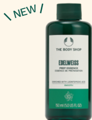
EDW エッセンスローション 化粧水 150mL 3,850円

パワフルな2種のエーデルワイスのエキス ※1 を配合した自然由来成分95%のウォータリージェル状洗顔料。ジェルから変化するやわらかな感触の泡で、ちりやホコリなどの肌に付着した空気中の微粒子の汚れなどすっきりと落とし、明るく弾むような肌へ導きます。