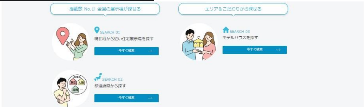
■VRだからこそ体験できる「モデルハウス」の新たな見方（上）と、複数の検索パターンでモデルハウスを探しやすいのが特長