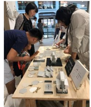
■ 「summer holiday」の取扱い商品例と、親子で楽しむ店内イメージ