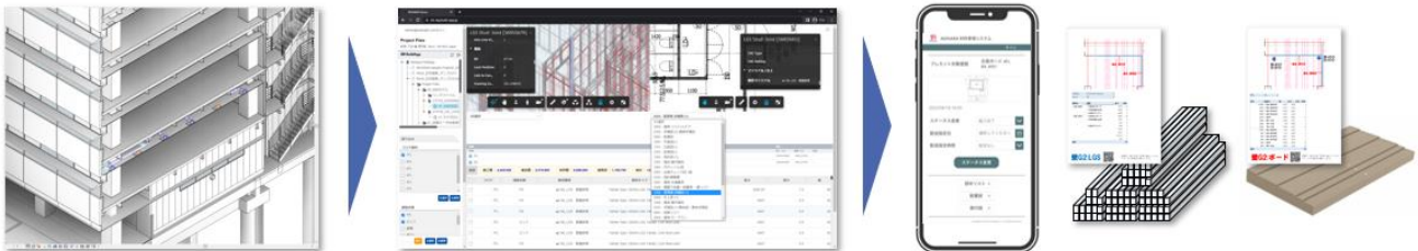
■BuildApp 内装のサービスイメージ

内装施工 BIM から、次工程以降に必要なレベルに BIM モデルを詳細化、建材の積算を自動化してプレカット、施工管理へ BIM 積算・プレカット「BuildApp 内装」は、施工現場での生産性向上・廃材料削減を目的とし、BIM データを情報基盤として、内装材の積算・見積・発注・プレカット・施工管理までを支援します。