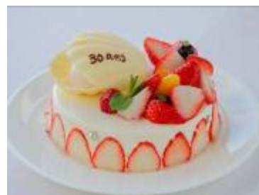
シェフパティシエ特製ケーキ

■三井不動産リゾートグループは、北海道から沖縄県・八重山諸島まで、全国 4カ所にてリゾート施設を展開しています（4施設 880 室）。今後も、豊かな自然と地域特性を活かした食・温泉・スパ・自然体験・ゴルフなどの多彩なサービスメニューやアクティビティー、ホスピタリティの高いおもてなしにより、魅力あふれる滞在空間の提供に努めてまいります。