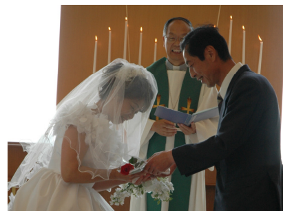
「真珠婚式」の様子（イメージ）