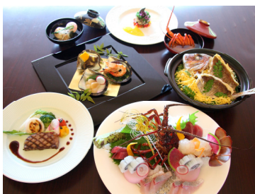
30 周年を祝う特別メニュー