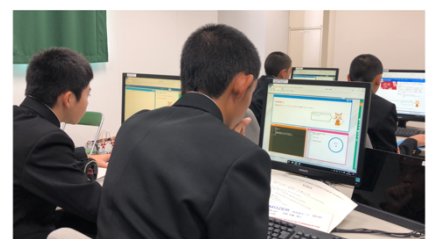
MOZERを使った学校の授業