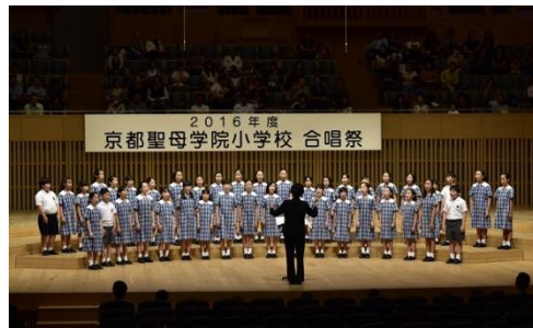
京都聖母学院小学校(合唱) ＋スペシャルゲスト