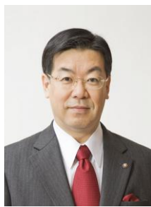
山田 啓二 京都府知事