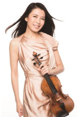
川井郁子 ヴァイオリニスト