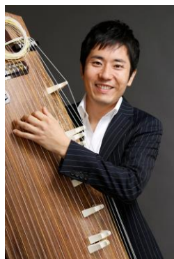
中井智弥 二十五絃箏奏者