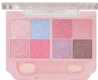
S01 オーロラキャンディ