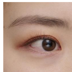
※仕上がりイメージ