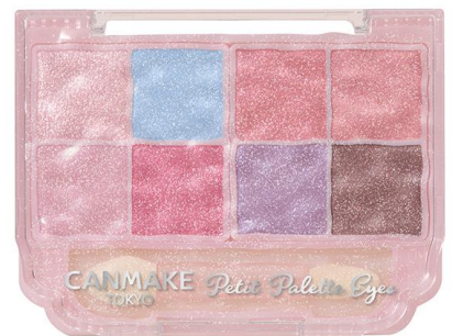
S01 オーロラキャンディ