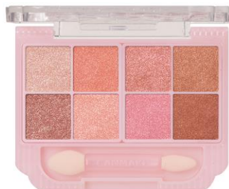
S02 マカロンキャンディ