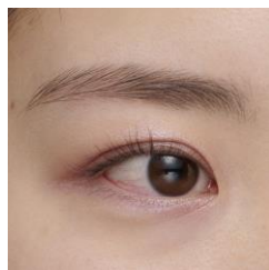
※仕上がりイメージ