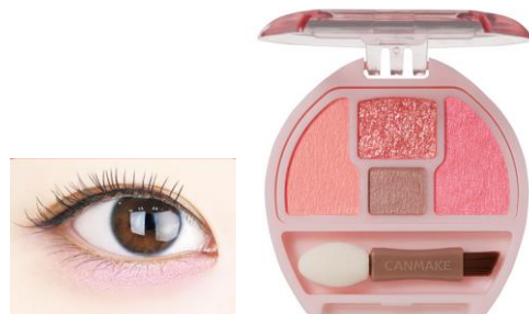
※仕上がりイメージ