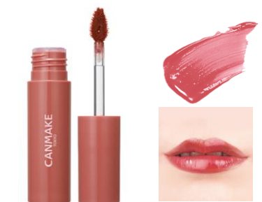
01 テンダーコーラル