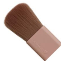
毛量たっぷり！ ふわふわなブラシ付