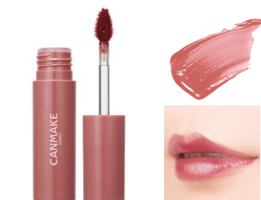
02 アイコニックローズ