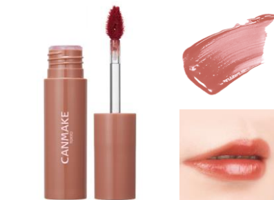
03 ジェントルベージュ