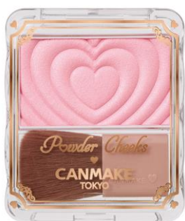
P02 リトルシャイピンク