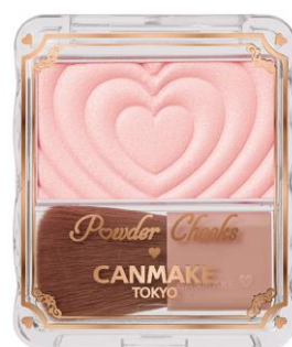
P04 クレバーベージュ