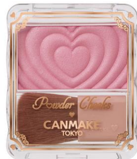
P05 クラッシーモーヴピンク