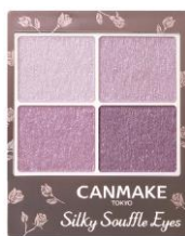
「シルキースフレアイズ 12」 ¥825（税込） ※限定発売品 販売終了