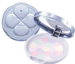
「イルミネイティングフィニッシュ パウダー ～Abloom～ 01」 ¥1,034（税込）

トレンドの“青みピンク”は、肌の血色感や透明感をUPしてくれる注目のカラーです。今年にはキャンメイクでも青み系のブルベさん向けカラーを数多く発売し、大好評いただきました。特に大人気だったのが、フィニッシュパウダーのツヤ肌タイプ「イルミネイティングフィニッシュパウダー ～Abloom～ 01」！ラベンダーカラーで儚げ透明感がUPして可愛く仕上がると、大きな反響をいただきました。このパウダーと合わせ使いがおススメのアイテムが、「むにゅっとハイライター」04ブルートパーズ。ブルーの偏光パールとシルバーパールが涼し気な肌を演出します。アイシャドウは、限定のパープルパレット「シルキースフレアイズ」12モーニングビオラが大ヒット！朝露に濡れたビオラのようなカラーで、目元に透明感を与えます。大人気リップ「むちぶるティント」からは待望の青みピンク06ラズベリーケーキが仲間入りして、くすみ感のある大人かわいいカラーが人気を集めました。ぜひこの冬もキャンメイクの青み系アイテムで、旬なブルベメイクを楽しんでくださいね♡