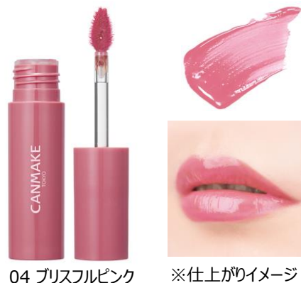
04 ブリスフルピンク