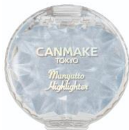
「むにゅっとハイライター 04」 ¥638（税込）