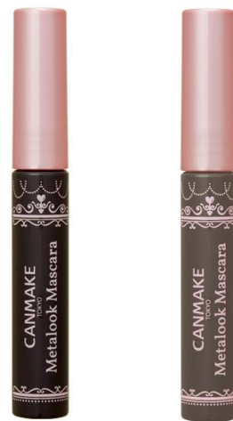
01 ブラック 03 スウィートブラック