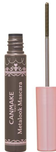
03 スウィートブラック