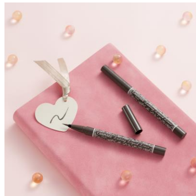
10 セピアグレージュ

やわらかなトーンのアイシャドウと合わせて使うことで、アイラインとのコントラストが 生まれ、程よい抜け感のある目元に仕上がります♡