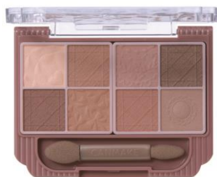
M01 メープルミルフィーユ