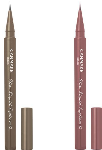
03 チャバグレイジュ