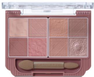
M03 ミルキーチェリコッタ