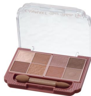
M01 メープルミルキーフュー