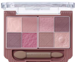
M02 ロマンティックフォグ