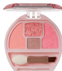
04 イチゴプランぷく