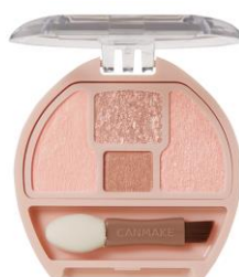
03 ミルクティプランぷく

また、03と04を重ねて使うと「イチゴミルクティプランぷく」に！ ミルキーピンクのやわらかなかわいい目元に仕上げます♡