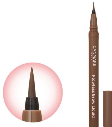
眉尻まで描きやすい細筆