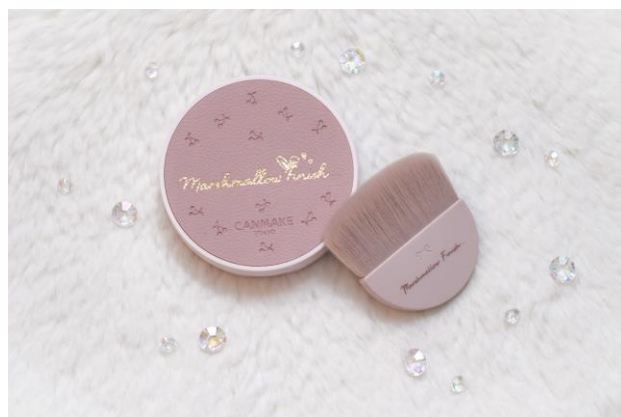
「マシュマロフィニッシュパウダー」限定パッケージとも相性バッチリ♡