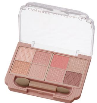
01 プリウムフラワー