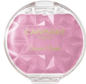
P05 パールライラック