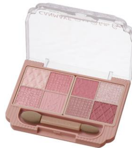
03 ミニョンヌリボン