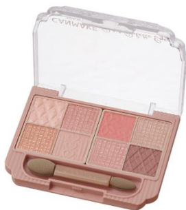
01 プリウムフラワー