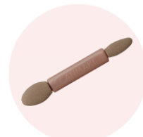
モチモチなチップ付き