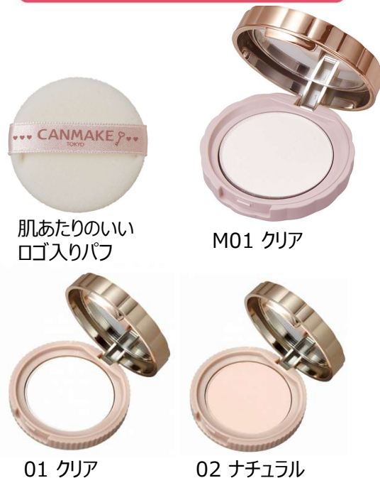
肌あたりのいい ロゴ入りパフ