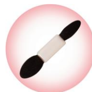
なめらかで上質な ダブルエンドチップ

※店舗様によって陳列開始日が異なる為、発売日の表記は「9月下旬」でお願いいたします。