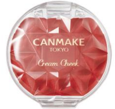
M01 アップルコンポート