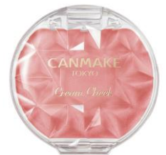
M03 マカロンフレーズ