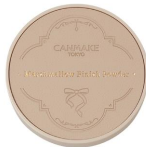
01 ディアレストブーケ