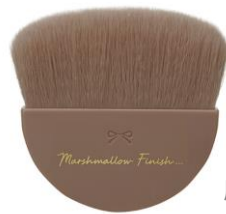
肌にパウダーがのせやすい 緩いラウンド形状のブラシ

※店舗様によって陳列開始日が異なる為、発売日の表記は「9月下旬」でお願いいたします。