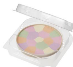
01 ディアレストブーケ