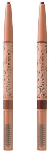
左から 04 ミルクティーブラウン 05 グレーブラウン

※店舗様によって陳列開始日が異なる為、発売日の表記は「8月下旬」でお願いいたします。 コスメカレンダー等で、どうしても日付が必要な場合は「8月31日」にてお願いいたします。