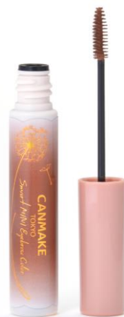
01 いつものブラウン。 地肌につきにくいミニのサイズブラシ

※店舗様によって陳列開始日が異なる為、発売日の表記は「8月下旬」でお願いいたします。