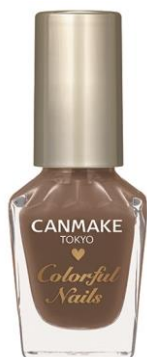
〈限定〉 N72 マロングラッセ