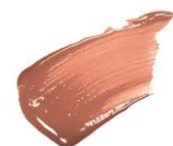
〈限定〉 08 ヘーゼルミルク

※店舗様によって陳列開始日が異なる為、発売日の表記は「7月下旬」でお願いいたします。