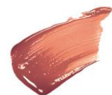
〈限定〉 07 フレーズロゼ