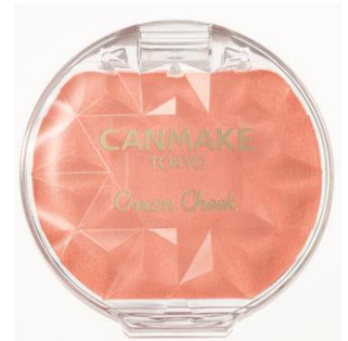
〈限定〉 P04 アプリコットシェル