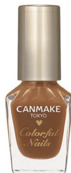
〈限定〉 N74 クレームブリュレ