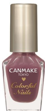
〈限定〉 N71 ムラサキイモ