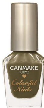
〈限定〉 N73 マッチャシロップ