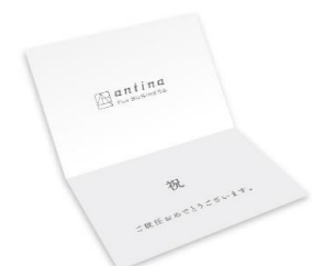
オリジナルメッセージカード