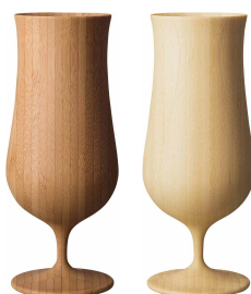
リヴェレット ピアベッセル

エコ素材として注目される「竹」を原料に、高い加工技術で繊細なシルエットと実用性を両立。