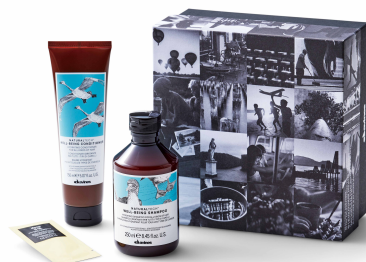
タヴィネス ナチュラルテック ヘアケアセット

「サステイナブルな美」をコンセプトに、全世界のヘアサロンで愛用されるヘアケアブランド。