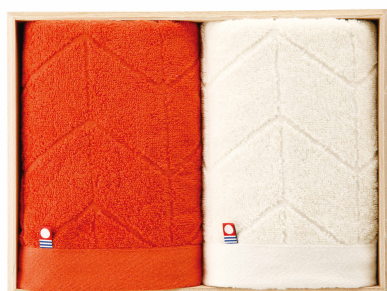
フェルガナ 木箱入り今治タオル

FERGHANA TOWEL PREMIUM SOFT COTTON MADE IN JAPAN