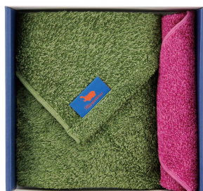
ヒポポタマス ウォッシュ&チーフ