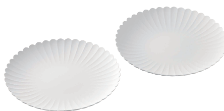
1616/ arita japan TY パレスプレート160ペア

400年もの歴史と現代のデザインが融合した、有田焼の新しいスタンダード。GOOD DESIGN AWARD 2019受賞(※)。