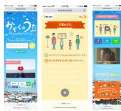
<スマートフォン画面>