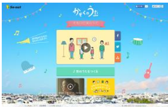
<うた再生終了後画面>