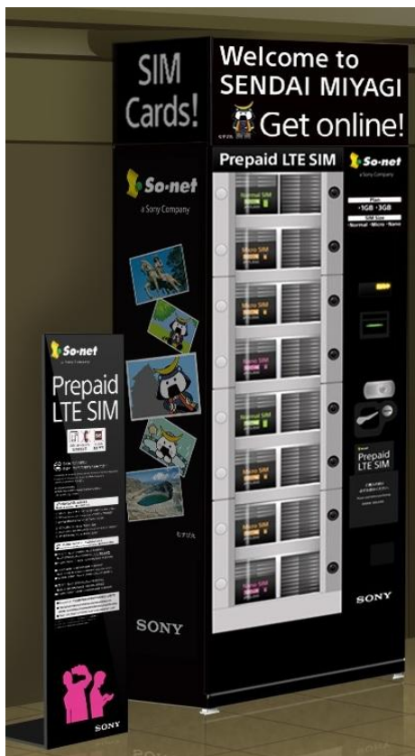
【自動販売機 イメージ図】