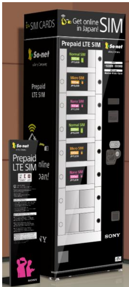
【自動販売機 イメージ図】