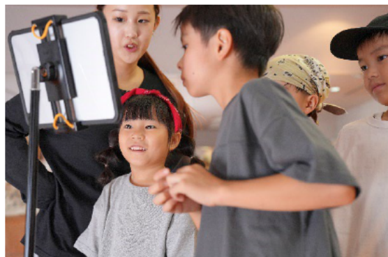
イメージ画像：スポーツ ICT ソリューションサービス(体操・ダンス)