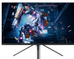
ゲーミングモニター INZONE M9