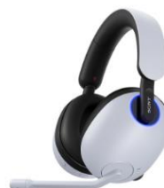
ワイヤレスノイズキャンセリング ゲーミングヘッドセット INZONE H9