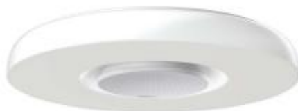
マルチファンクションライト LGTC-20 セットモデル(LGTC-20、LGTG-100)

ソニーネットワークコミュニケーションズ株式会社は、人感・温度・湿度・照度のセンサー、マイク、スピーカーなどを内蔵した照明器具マルチファンクションライト(*1)を活用した賃貸不動産向けの高齢者見守りサービスを6月下旬より提供開始します。賃貸物件に単身で居住する高齢者が主な対象で、本日3月8日より受付を開始します。サービス開始時は、株式会社シーラ、株式会社ランドネットと連携して提供します。