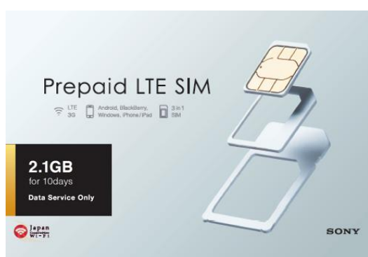
「2.1GB プラン」パッケージ

ソニーネットワークコミュニケーションズ株式会社（以下、ソニーネットワーク）は、プリペイド式モバイルデータ通信サービス「Prepaid LTE SIM」において、「2.1GB プラン」、「Unlimited Data プラン」の 2 つの新プランを追加し、本日 10 月 15 日より提供を開始します。