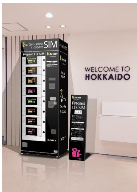
【設置イメージ図：国際線ターミナルビル2階到着ロビー内の便利なロケーション】

北海道の空の玄関口となる新千歳空港での自販機設置により、北海道を訪れる外国人旅行者のインターネット接続がさらに便利で快適になります。