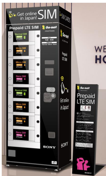
【自動販売機 イメージ図】