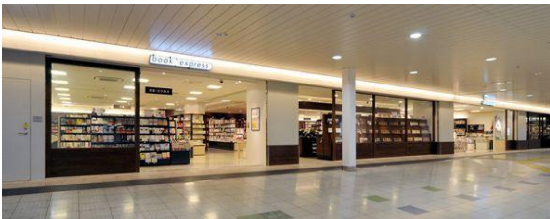
【book express エキナカ上野店】

このたびの『Prepaid LTE SIM』販売は、こうしたニーズに応えるものです。今回販売する JR 3 駅は、いずれも新幹線への乗り換えができ、地方都市や観光・レジャー施設との移動の間に、エキナカで手軽に通信手段を確保できるようになります。書店で販売するため、乗り換えの待ち時間にガイドブックや書籍と同時に購入することもできます。