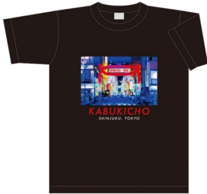
Tシャツ 2,970 円