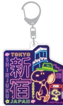
アクリルキーホルダー 660 円