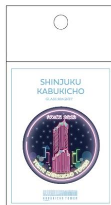
ガラスマグネット