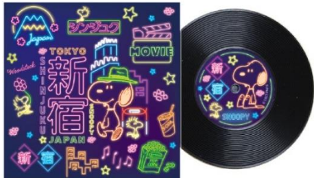
レコード風コースター 880 円