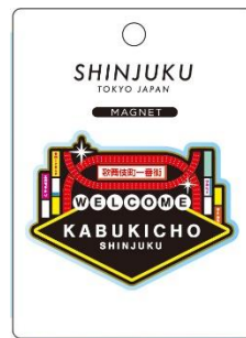
メタルマグネット 770 円