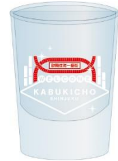
ショットグラス 770 円