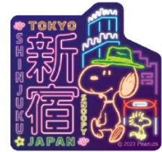
ステッカー 550 円