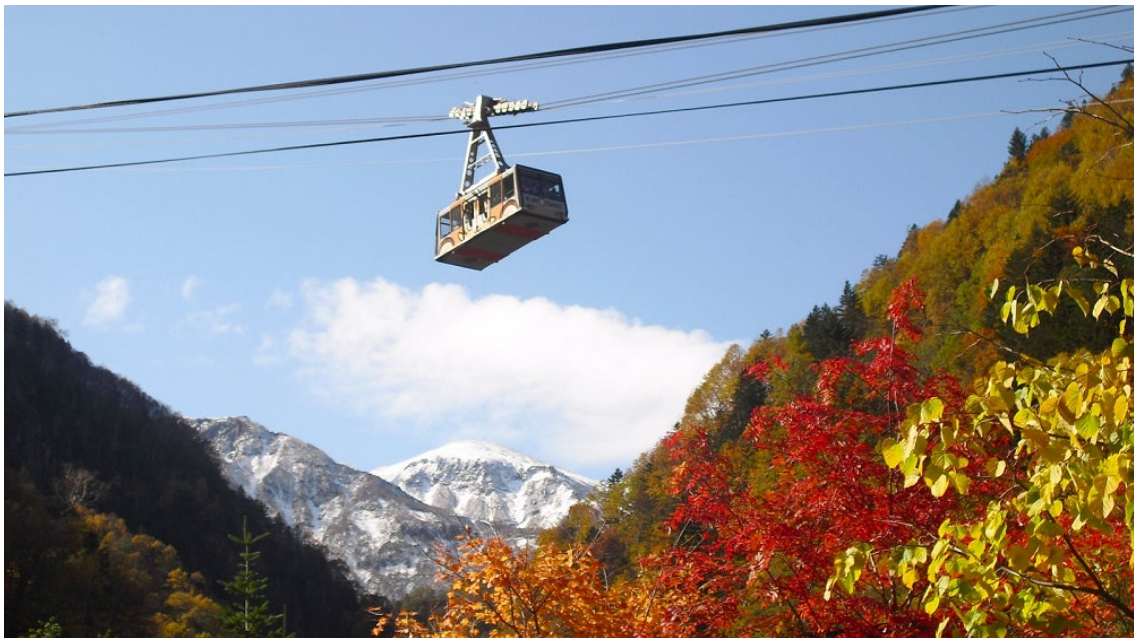
層雲峡温泉黒岳ロープウェイ