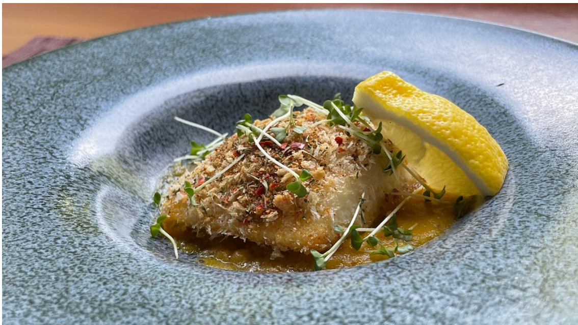
和寒かぼちゃソースで食べる！美深産チョウザメ香草パン粉焼き

ソースには隣町の愛別産まいたけを使用し、きのこ本来の旨味を閉じ込めたソースと一緒に召し上がりがり下さい。