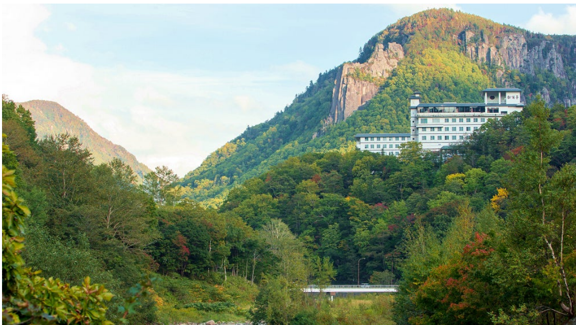
層雲峡 朝陽亭外観

大自然に囲まれた層雲峡は一年を通して景色が美しいですが、秋の見ごろは格別！ 美味しい秋の味覚とともに、景色も含めてご旅行をお楽しみいただけたら幸いです。 層雲峡温泉で、あなたのお越しをお待ちしております♪