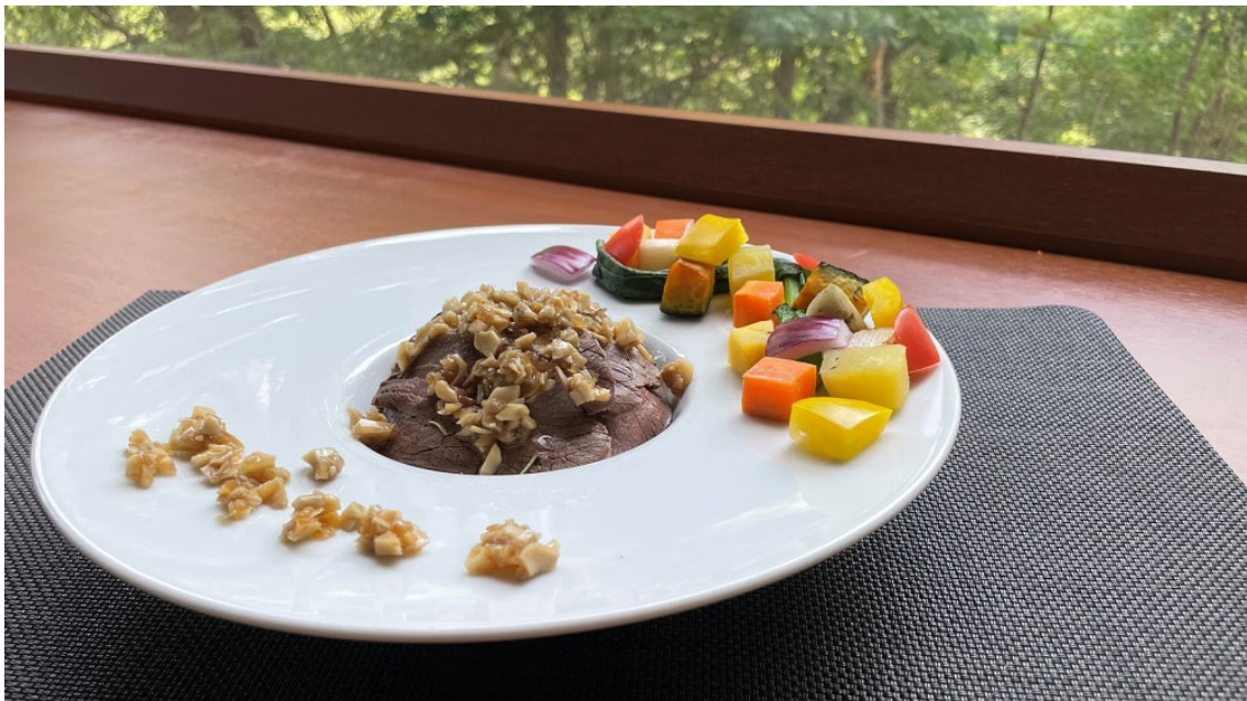
愛別産まいたけソースで食べる♪エゾシカ肉低温料理ロースト～6種類の野菜と共に