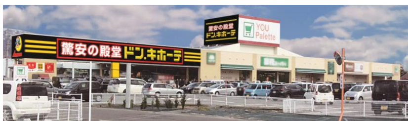
「ドン・キホーテ信州中野店」外観イメージ

株式会社ドン・キホーテ（本社：東京都目黒区、代表取締役社長：吉田直樹）は、2020年12月18日（金）に、長野県中野市に所在する高井富士ショッピングセンター内に、「ドン・キホーテ信州中野店」をオープンします。