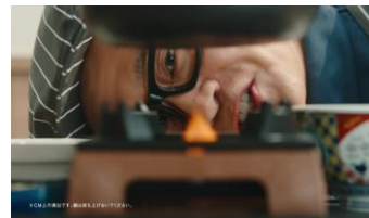
宮川さん「ええっ！ええっ！？めっちゃ火ついとるやん！」