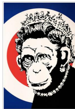
BANKSY MONKEY QUEEN