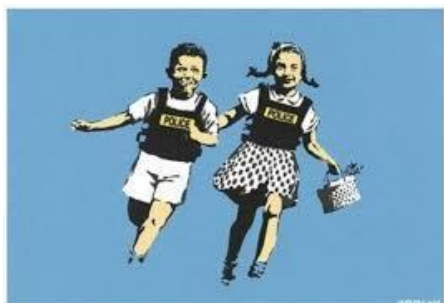
BANKSY JACK AND JILL