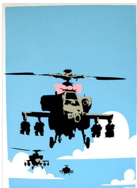
BANKSY HAPPY CHOPPERS