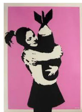
BANKSY BOMB HUGGER