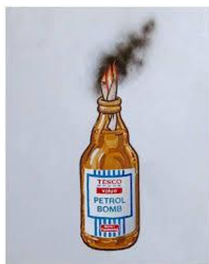
BANKSY TESCO PETROL BOMB