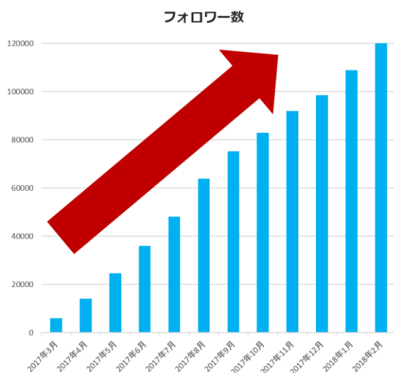
図2. 1年間での増加フォロワー数の推移