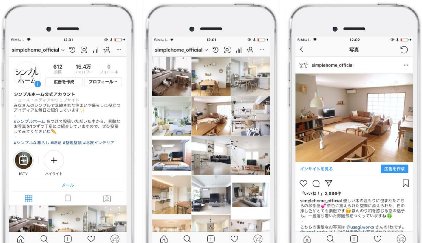
図1. シンプルホーム公式アカウントのイメージ

また、今回のシンプルホームの広告メニューの正式販売を記念して、 7,8月にお申し込みいただいた先着15社限定で、すべての広告メニューを25%オフにてご提供いたします。 ぜひこの機会にシンプルホームを活用した広告施策についてご検討くださいませ。媒体資料をご希望の場合、下記お問い合わせ先までご連絡くださいませ。