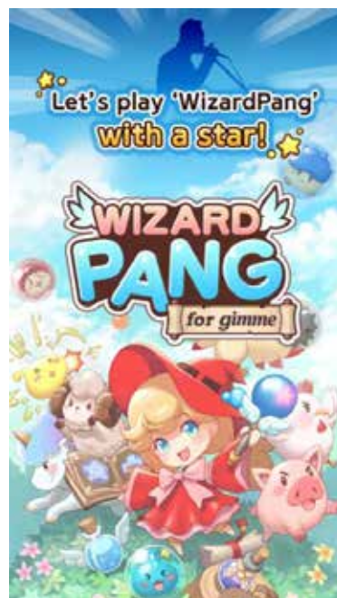
「WizardPang for gimme」