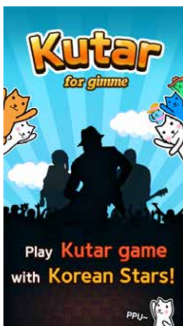
「Kutar for gimme」