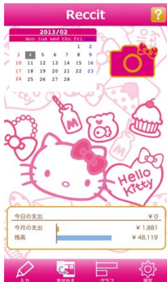
(株式会社サンリオウェブ様)

気分に応じてデザインを変えたり、アドオンストアから新しいテーマコンテンツをダウンロードしたり。家計簿をつけるのも楽しくなること間違いなし！