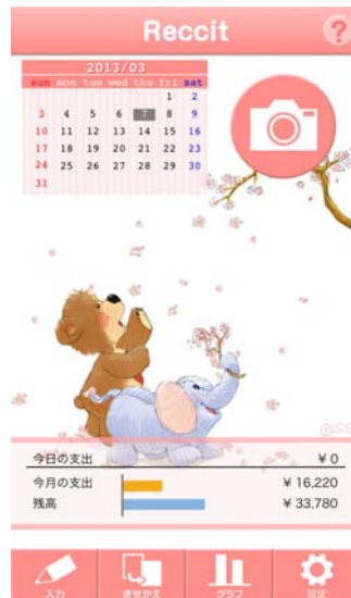
(ネオス株式会社様)