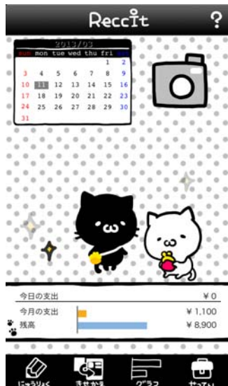
(株式会社インクルーズ様)