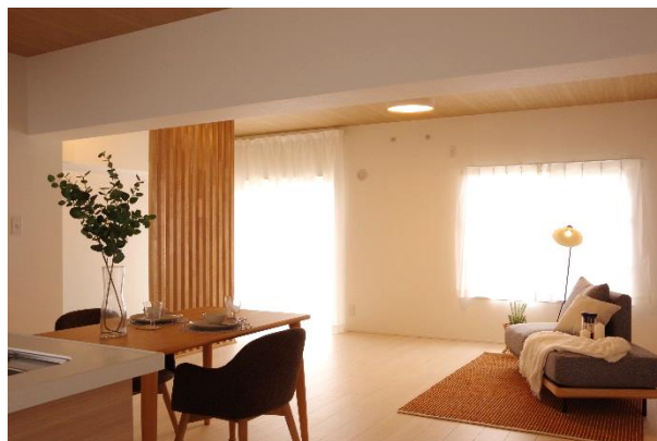
準グランプリ作品「Look at - 家事を見せるんだー」