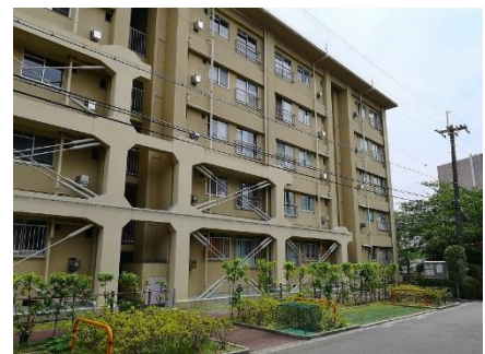
△香里三井B団地 外観