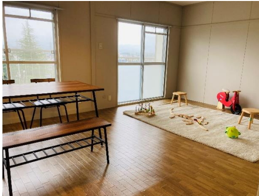
△室内写真（茶山台 B 団地）

大阪府内において公社賃貸住宅 SMALIO（スマリオ）を提供する大阪府住宅供給公社（本社：大阪市中央区、理事長：山下 久佳、「以下、公社」）は、下田部団地（高槻市）と茶山台 B 団地（堺市南区）において、多様なワークスタイルのニーズに対応するため、スペースの広さという特徴を最大限に生かし職住一体型とした2戸1化住戸リノベーション『フレックスダブル』を初めて実施し、1月31日（月）から入居者募集を開始します。また、募集に先駆け、1月29日（土）、30日（日）に茶山台 B 団地でオープンルームを実施しますので、お知らせします。