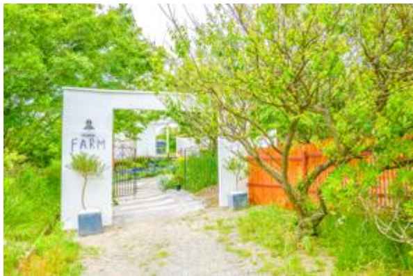
エントランスゲート