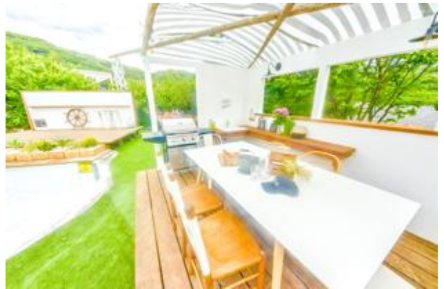
プライベートキッチンE (4名から6名)