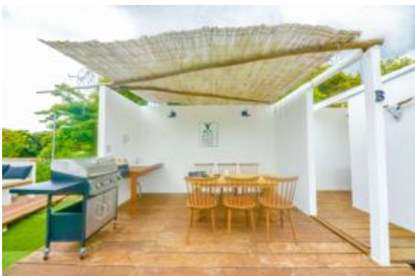
プライベートキッチンB (4-6名)