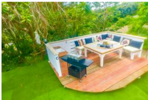
プライベートキッチンC (6-12名)