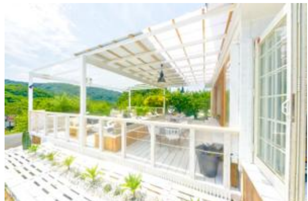
RECEPTION & SHOP側のエントランス