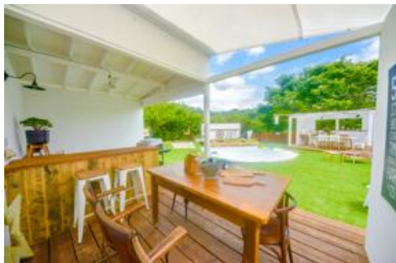
プライベートキッチンA (6-12名)