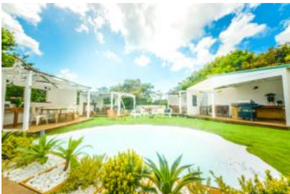
プライベートキッチンBBQエリア

小さなビーチと人工芝でできた空間に5つのプライベートキッチンBBQの部屋があり、それぞれご予約でプライベートな空間としてご利用いただけます。食材と飲み物はご提供となり、セルフでBBQコンロで焼いてお楽しみいただけます。