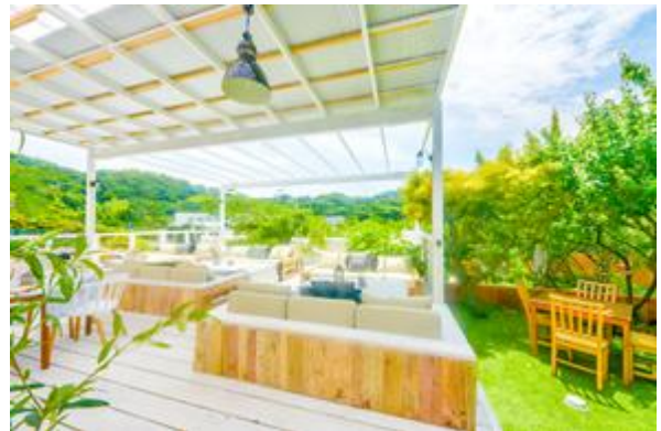
ソファ席は4名からご利用いただけます。