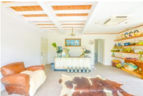
RECEPTION & SHOP