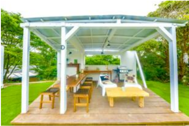
プライベートキッチンD (6名から12名)