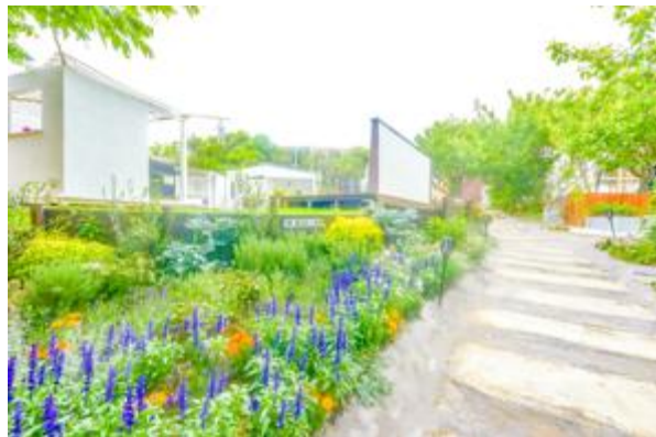
プライベートキッチンBBQエリアやグリルレストランへの石畳の道