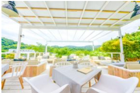
山を見渡せる、緑いっぱいのテラスグリルダイニング

石畳を抜けた、BBQエリアの反対側には80平米のテラスグリルダイニングとTHE HOUSE SHOPがあります。