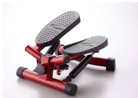
【ナイスデイ 商品画像】